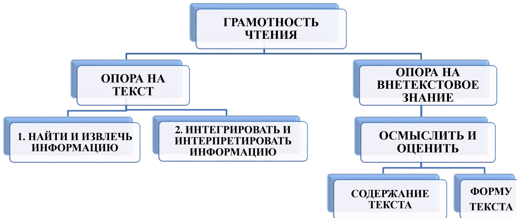
Схема 1. Читательская грамотность

Интегрировать - объединить части чего-либо в одно целое.