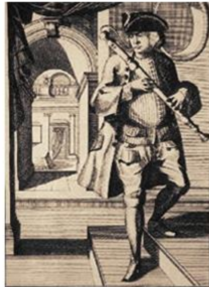
Johann Christoph Denner (1655 - 1707)