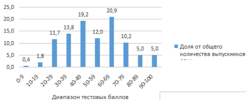
Распределение тестовых баллов по результатам ЕГЭ по математике